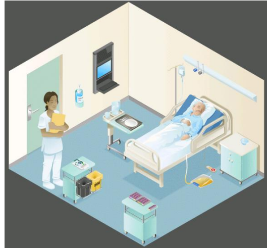
RUAULT Célia - IMH des EHPAD du 93