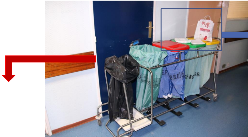
RUAAULT Célia - IMH des EHPAD du 93

Matériel nécessaire aux changes (circuit propre)